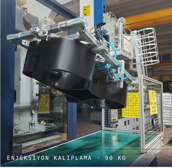
ENJEKSİYON KALIPLAMA · 90 KG