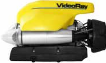
Standart VideoRay Pro 4 ROV Ünitesi