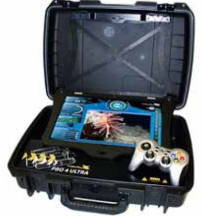
Ultra Panel PC Dokunmatik Tablet Modülü