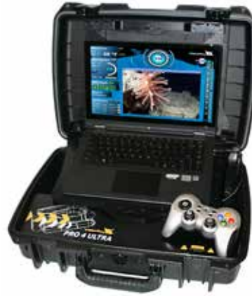
Ultra Panel PC Klavye Modülü